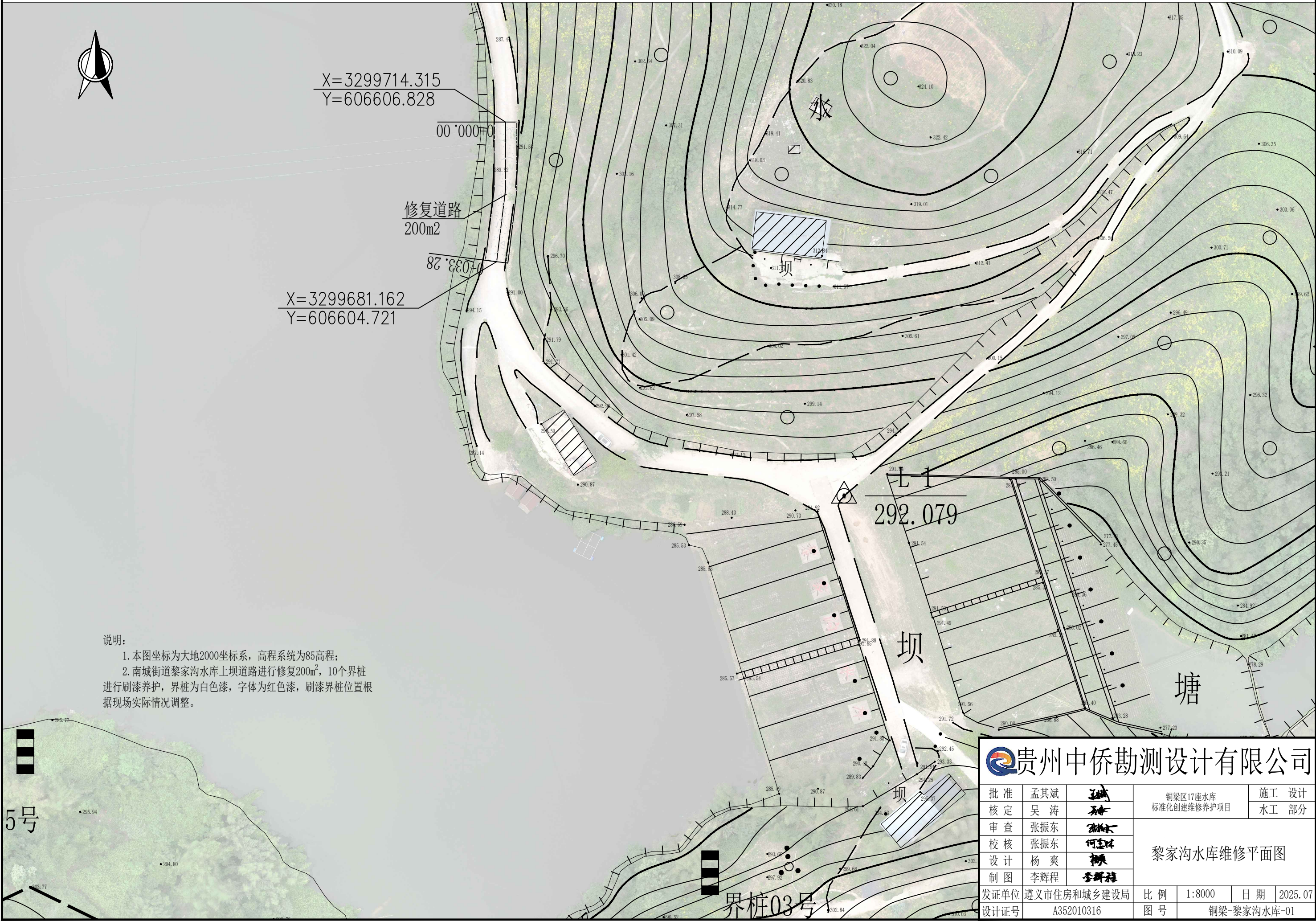
南城街道黎家沟水库维修养护平面布置图