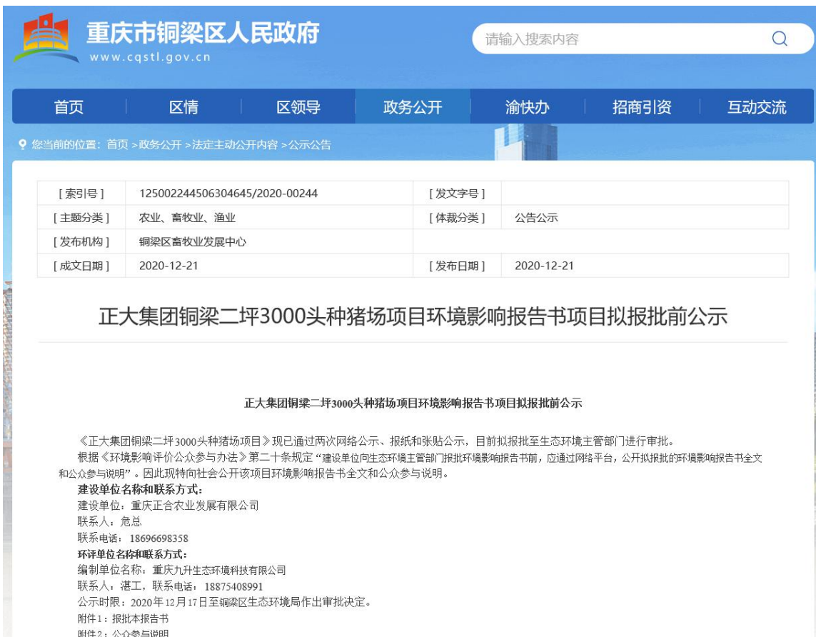
图 6.2-1 拟报批前网络公示截图

载体选取符合性分析：建设单位选取“铜梁区人民政府网站”（ https://www.cqstl.gov.cn/zwgk_171/fdzdgknr/gsgg_40248/202012/t20201221_8672102.html ）进行拟报批公示，为符合要求的正规公开网站，符合《环境影响评价公众参与办法》（生态环境部令第4号）相关要求。