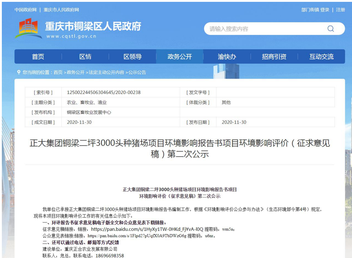
图 3.2-1 第二次网络公示截图