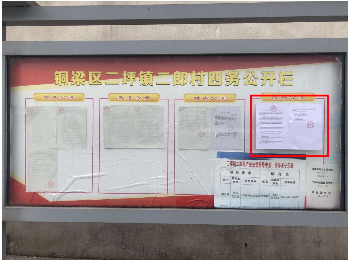
现场张贴公示远照

建设单位于2020年11月30日在二坪镇二郎村公示公开栏张贴相关信息，2020年12月11日至公告栏进行检查，项目环境影响评价张贴信息仍完整保留在公告栏内。张贴日期满足10个工作日要求。现场张贴截图见图3.2-4。